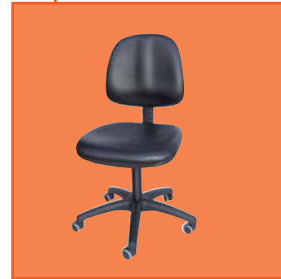
Kunstleder Modell 6162.17