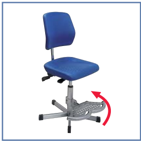
Modell 5222.06 mit Fußstütze B