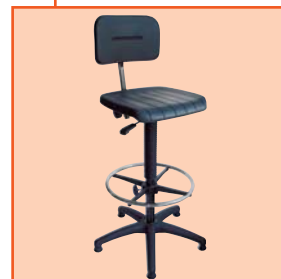
Modell 6175.01 mit Fußring