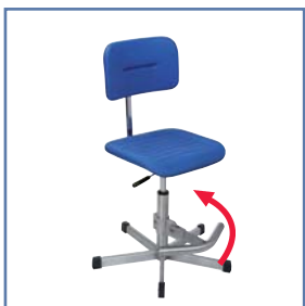
Modell 5115.09 mit Fußstütze A