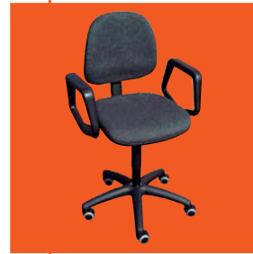
Modell 6162.15 mit Armlehnen B0901700